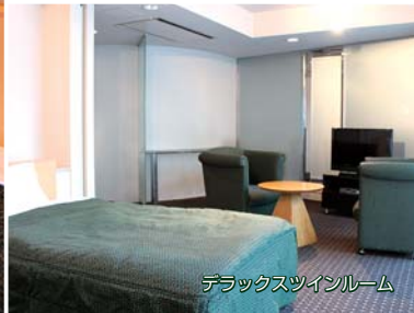
デラックスツインルーム