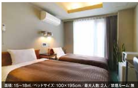
面積: 15~18㎡ / ベッドサイズ: 100×195cm / 最大人数: 2人 / 禁煙ルーム: 無 ツインルーム