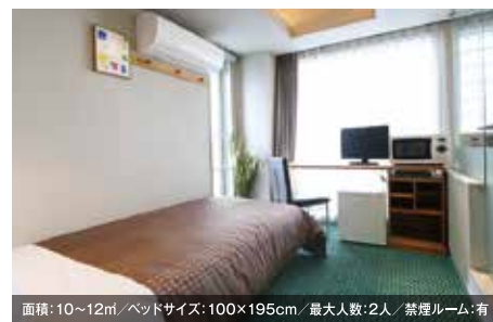
面積: 10~12㎡ / ベッドサイズ: 100×195cm / 最大人数: 2人 / 禁煙ルーム: 有 シングルルーム