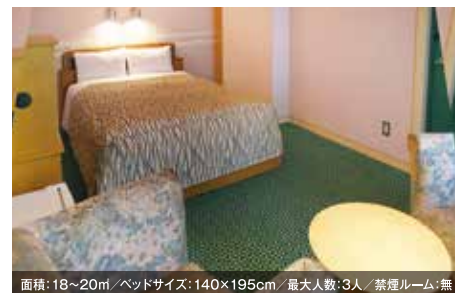
面積: 18~20㎡ / ベッドサイズ: 140×195cm / 最大人数: 3人 / 禁煙ルーム: 無 デラックスダブルルーム