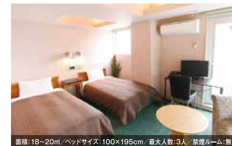
面積: 18~20㎡ / ベッドサイズ: 100×195cm / 最大人数: 3人 / 禁煙ルーム: 無 デラックスツインルーム