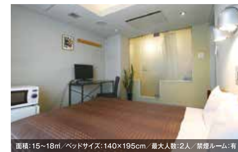
面積: 15~18㎡ / ベッドサイズ: 140×195cm / 最大人数: 2人 / 禁煙ルーム: 有 ダブルルーム