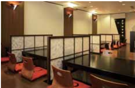
レストラン(海南風)