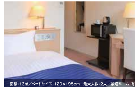
面積: 13㎡/ベッドサイズ: 120×195cm/最大人数: 2人/禁煙ルーム: 有 シングルルーム