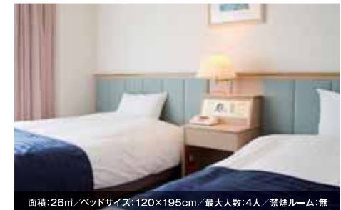
面積: 26㎡/ベッドサイズ: 120×195cm/最大人数: 4人/禁煙ルーム: 無 ツインルーム