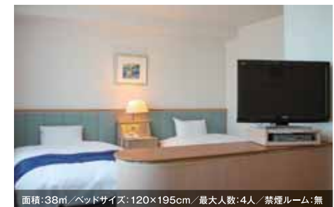
面積: 38㎡/ベッドサイズ: 120×195cm/最大人数: 4人/禁煙ルーム: 無 デラックスツインルーム