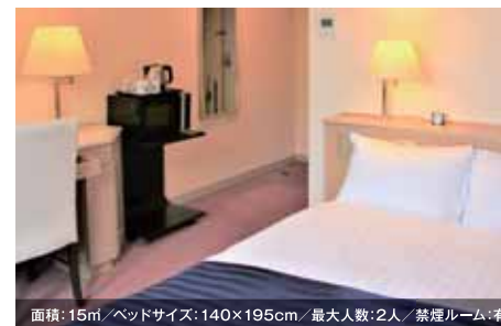
面積: 15㎡/ベッドサイズ: 140×195cm/最大人数: 2人/禁煙ルーム: 有 ダブルルーム