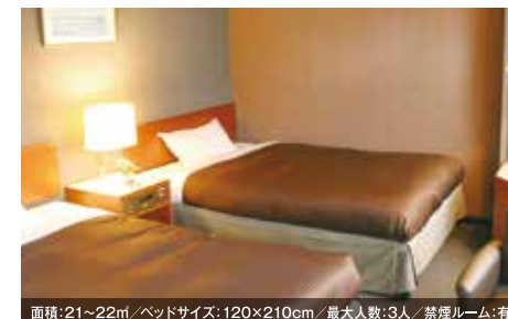
面積:21~22㎡/ベッドサイズ:120×210cm/最大人数:3人/禁煙ルーム:有 ツインルーム