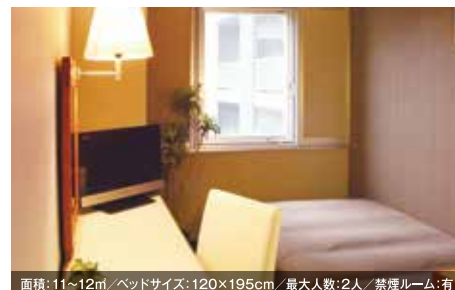
面積:11~12㎡/ベッドサイズ:120×195cm/最大人数:2人/禁煙ルーム:有 シングルルーム