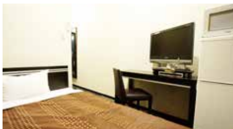
面積: 12㎡ / ベッドサイズ: 120×195cm / 最大人数: 2人 / 禁煙ルーム: 有 シングルルーム

We welcome simply and comfortable room, have a good relax time.