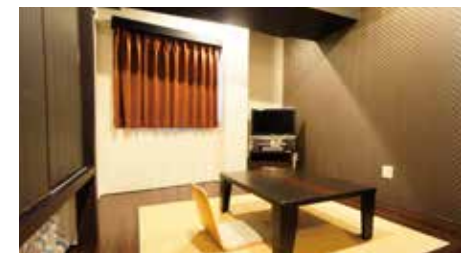
面積: 17㎡ / 最大人数: 3人 / 禁煙ルーム: 有 和室