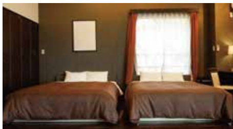
面積: 64㎡ / ベッドサイズ: 160×195cm / 最大人数: 6人 / 禁煙ルーム: 無 ラグジュアリールーム