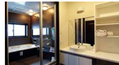
ラグジュアリールーム