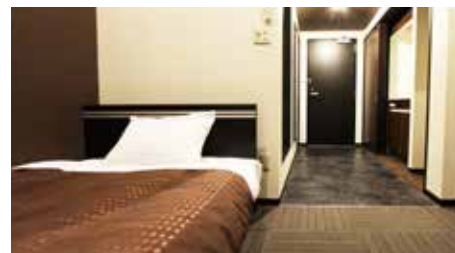
面積: 16㎡ / ベッドサイズ: 120×195cm / 最大人数: 4人 / 禁煙ルーム: 有 マックスルーム