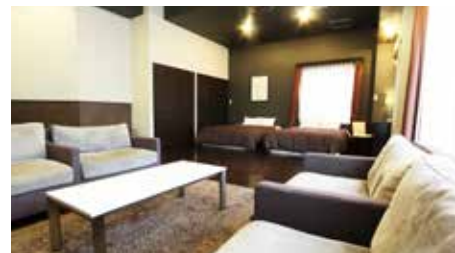
ラグジュアリールーム