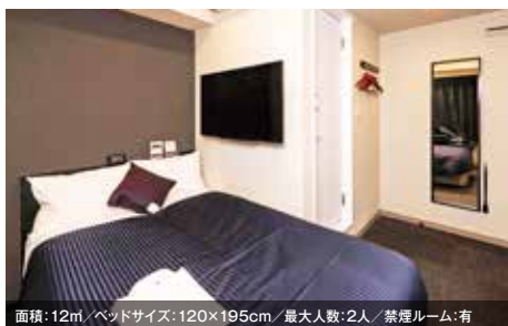
面積: 12㎡ / ベッドサイズ: 120×195cm / 最大人数: 2人 / 禁煙ルーム: 有 シングルルーム

We welcome simply and comfortable room, have a good relax time.