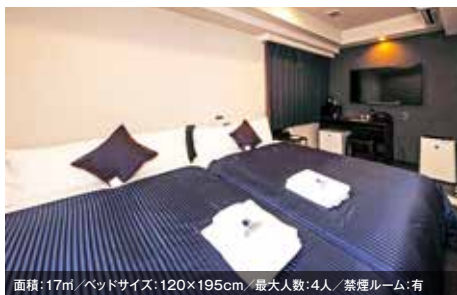
面積: 17㎡ / ベッドサイズ: 120×195cm / 最大人数: 4人 / 禁煙ルーム: 有 ツインルーム