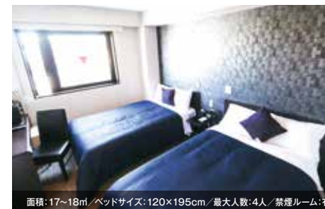
面積:17~18㎡/ベッドサイズ:120×195cm/最大人数:4人/禁煙ルーム:有 ツインルーム