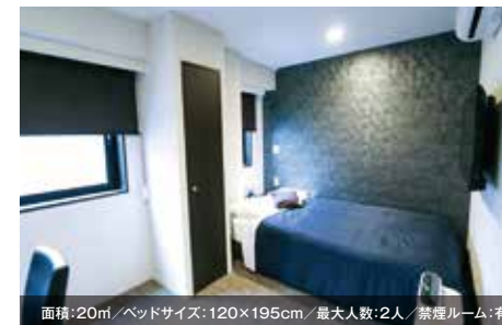
面積:20㎡/ベッドサイズ:120×195cm/最大人数:2人/禁煙ルーム:有 シングルルーム(福祉対応可)