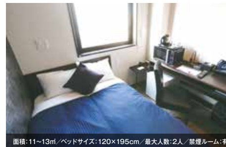
面積:11~13㎡/ベッドサイズ:120×195cm/最大人数:2人/禁煙ルーム:有 シングルルーム