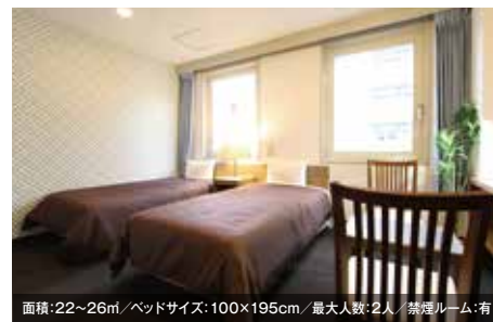
面積:22~26㎡/ベッドサイズ:100×195cm/最大人数:2人/禁煙ルーム:有 ツインルーム