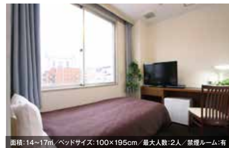
面積:14~17㎡/ベッドサイズ:100×195cm/最大人数:2人/禁煙ルーム:有 シングルルーム