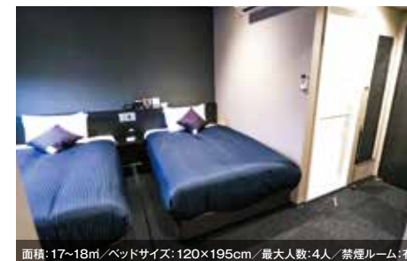
面積: 17~18㎡ / ベッドサイズ: 120×195cm / 最大人数: 4人 / 禁煙ルーム: 有 ツインルーム