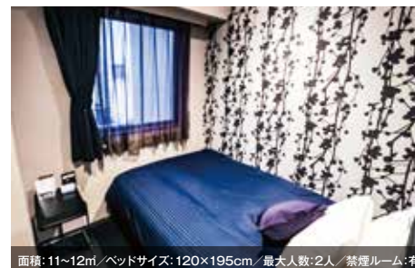
面積: 11~12㎡ / ベッドサイズ: 120×195cm / 最大人数: 2人 / 禁煙ルーム: 有 シングルルーム