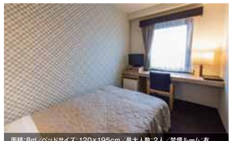
面積: 8㎡/ベッドサイズ: 120×195cm/最大人数: 2人/禁煙ルーム: 有 シングルルーム

We welcome simply and comfortable room, have a good relax time.