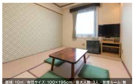
面積: 10㎡/布団サイズ: 100×195cm/最大人数: 3人/禁煙ルーム: 無 和室