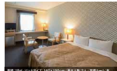
面積: 18㎡/ベッドサイズ: 140×195cm/最大人数: 2人/禁煙ルーム: 有 ダブルルーム