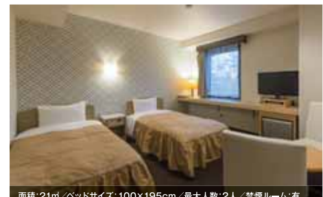
面積: 21㎡/ベッドサイズ: 100×195cm/最大人数: 2人/禁煙ルーム: 有 ツインルーム